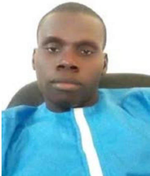
Le plus jeune maire.

C'est souvent le refrain des hommes politiques : place aux jeunes ! Et quand sonne l'heure des actes, silence radio. Mais pour ces communales, Kalalé aura montré le chemin.